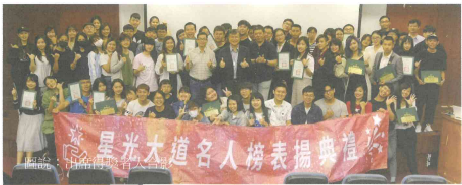
圖說：出席得獎者大合影