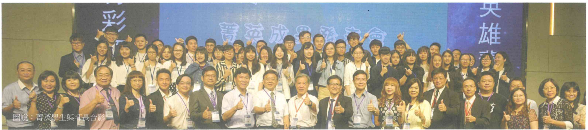
圖說：菁英學生與師長合影