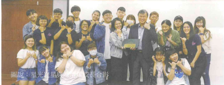
圖說：星光之星與系所主任校長合影