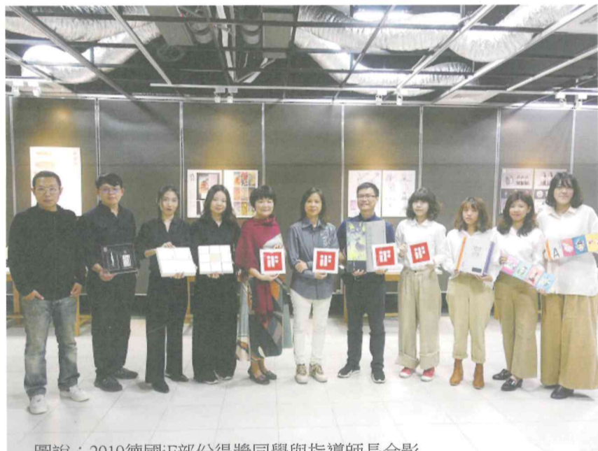
圖說：2019德國iF部份得獎同學與指導師長合影