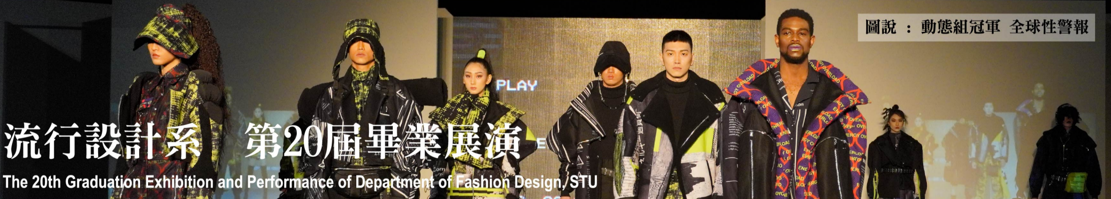
圖說：動態組冠軍 全球性警報

滿想像力，大主題「20 X 廿_THE20th」意謂著「20歲」已邁向「成年」的里程碑，藉此精神和意象來詮釋20屆的我們不斷地向前邁進，在設計與創作的道路上，能秉持正向的態度前行，百折不撓，面目一新，期許即將邁向嶄新生活的畢業生們，能在創作中再次尋找自我的價值，為20歲畫上最圓滿的成年禮。