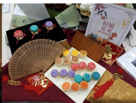
圖說：2019 AFA 韓國世界廚藝 大賽 - 蕭于瑄得獎作品