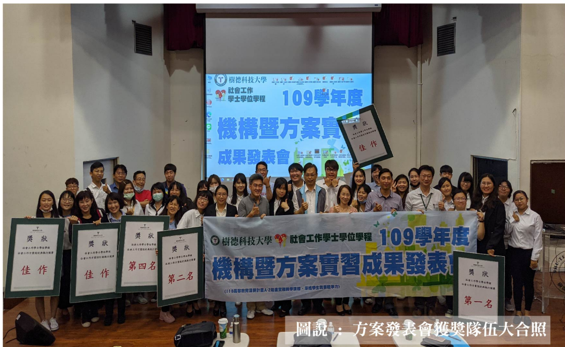
圖說：方案發表會獲獎隊伍大合照

【本校訊】社會工作學士學位學程於110年4月10日辦理方案實習成果發表會，由四技四年級與二技二年級學生組成9組團隊，分別至社福機構進行長達至少6個月以上的方案設計與執行，並進行方案成效評估。各組發揮團隊合作精神，盡力將方案活動實作內容呈現於全體師生面前。透過方案實習成果發表，學生得以檢視社工專業學習成效，以增進未來就業職能。全系師生共同參與聆聽方案實習發表，並特別邀請三位外聘專家學者就社會工作專業性(含專業理論與技術之運用)與方案執行與成效等面向，給予學生方案成果精闢的建議。