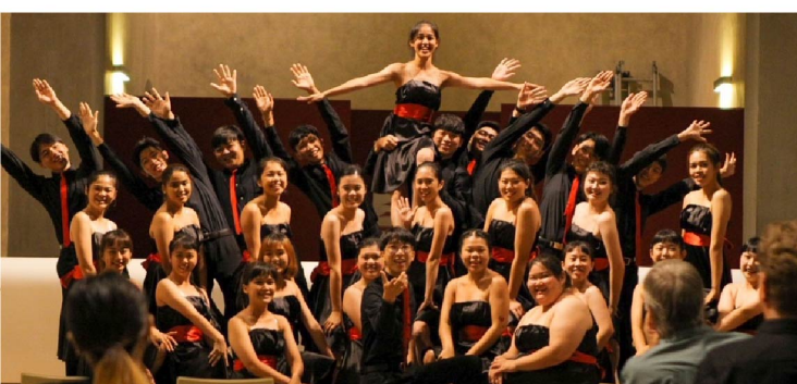
圖說：Choral Grand Prix Competition大獎賽 參賽者合照