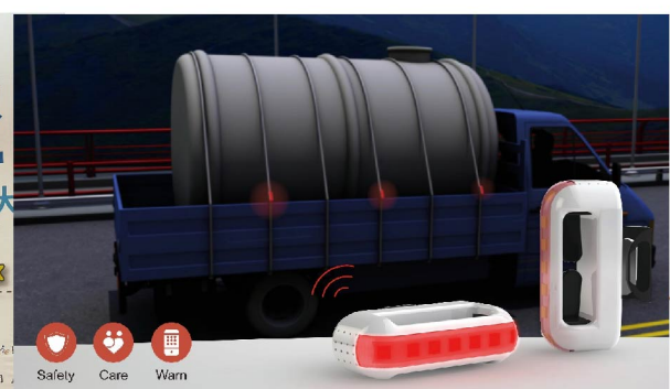
圖說：2019第十屆IIIC國際創新發明競賽 得獎作品