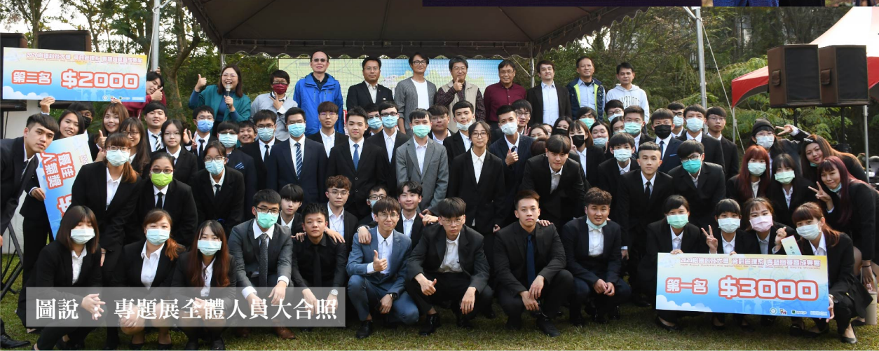
圖說：專題展全體人員大合照

【本校訊】自古以來，蓋教堂最後置放頂石的重要時刻，頂石放上後，教堂變成一個完整個體，教堂能否抗百年風雨或瞬間灰飛煙滅都在此一刻，學生經過大學四年的學習，藉由實務專題檢視同學四年大學所學專業能力，也是生活體驗以及創新創意的整體展現，近年來隨著全球化經濟與資通訊科技的加速發展，使得就業競爭越來越激烈。2020年樹德科技大學資訊管理系專題競賽暨成果展共22組成果，各組互相切磋、觀摩、與介紹自己的得意作品，實務專題展是磨練自己的各項專業技術並建立與外界連結的大好機會，也觀摩他人的創意成就，期望同學都能秉持著這股衝勁與毅力，一一的去克服與解決，設定前瞻的目標，不畏學習的艱辛，提升自我的管理，達成各位的理想目標，運用相關的知識與技術，發揮團隊合作的精神，定能有著充實與完美的內容。