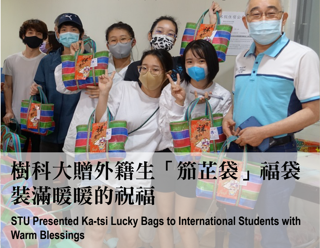
圖說：圖說二：嚴大國副校長(右)致贈「筍芷袋」福袋