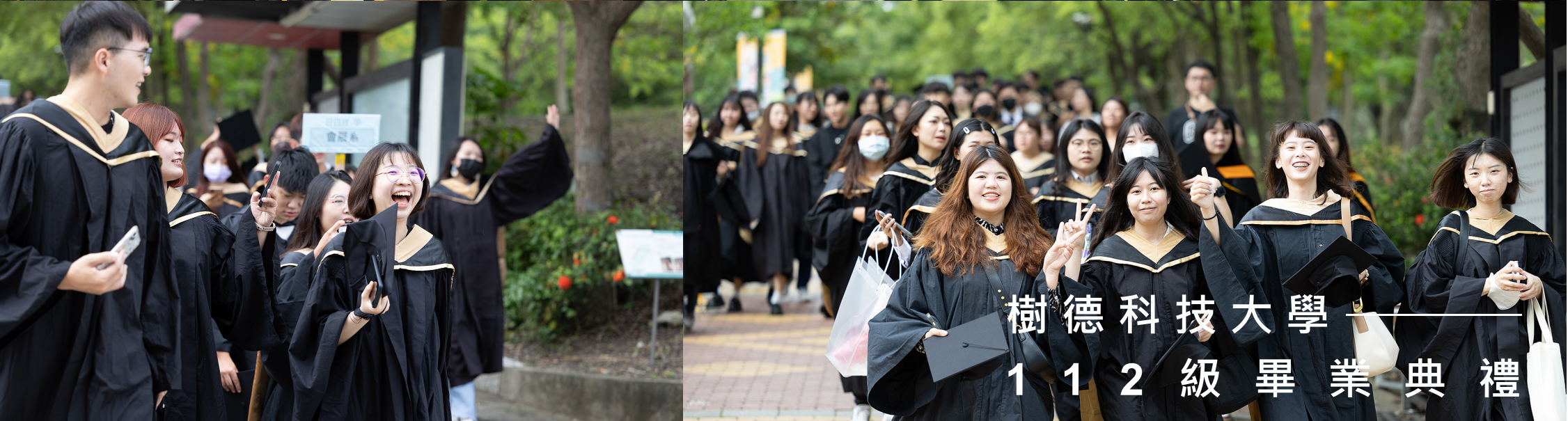
樹德科技大學 112級畢業典禮