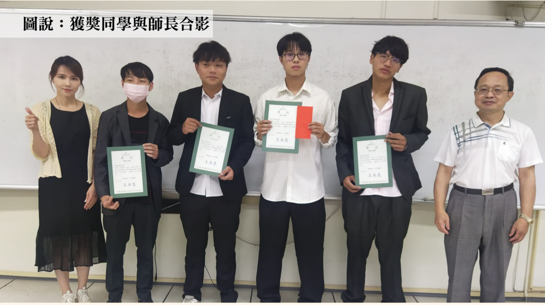
圖說：獲獎同學與師長合影

【本校訊】資工系實務專題競賽已圓滿落幕，優勝作品為「基於人工智慧之水果辨識系統」，此專題融合樹莓派硬體平台、OpenCV圖像處理技術以及深度學習模型，成功實現對水果種類的準確辨識。該項目凸顯了學生對不同領域知識的整合能力，以及將技術應用於解決實際問題的能力。