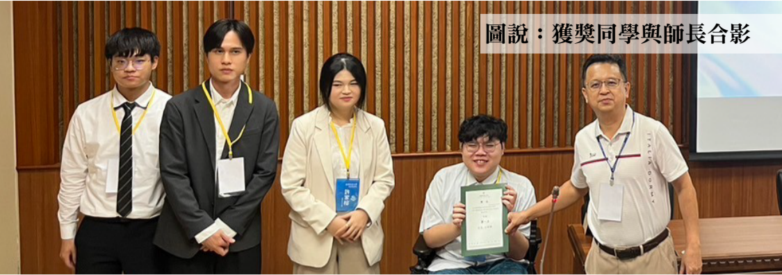
圖說：獲獎同學與師長合影

【本校訊】面對現代科技帶來的挑戰和機會，積極鼓勵學生利用創造力和創新精神來完成專題作品，將理論知識與實踐完美結合，在「2023年樹德科技大學資訊管理系專題競賽暨成果展」中，學生展示他們在大學四年中累積的實力。專題包括針對教育領域的自學輔助系統、面向企業的客户關係管理網站，以及大數據分析平台，這些都不僅解決特定行業的關鍵問題，也為未來提供可行的解決方案。