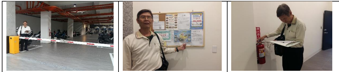
九、11月27日(覆檢-合格) 燕巢區鳳雄里鳳旗路86之5號租屋群警、消防屋安全評核情形