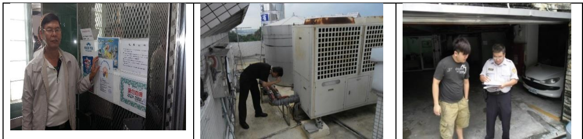
十四、11月27日(覆檢-合格)：高雄市大社區保社里15鄰萬金路357號租屋群安全評核情形