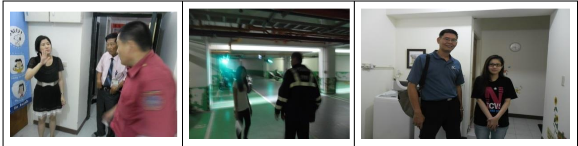
十三、11月27日(覆檢-合格)：大社區學府路200巷2號租屋群警、消租屋安全評核情形