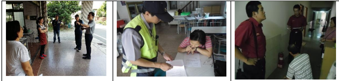
三、11月6日(覆檢-合格) 燕巢區東川路15-8號2樓之11租屋群警、消租屋安全評核情形-實施複檢