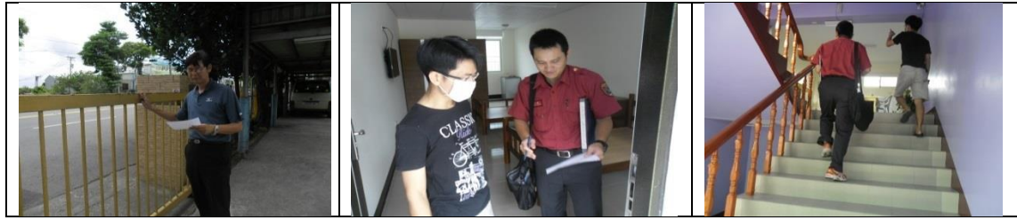
廿一、12月11日(覆檢合格)：大社區萬金路13-3號2樓租屋群警、消防屋安全評核情形