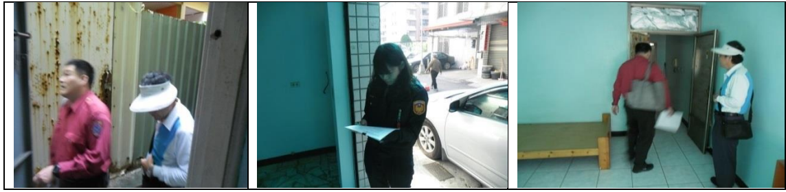
十二、11月27日(覆檢-合格)：楠梓新路261巷16弄12號4樓租屋群警、消租屋安全評核情形