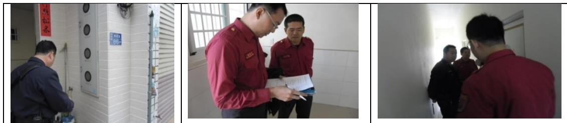
十、11月27日(覆檢-合格)：楠梓區中陽里朝明路114-1號租屋群警、消防屋安全評核情形