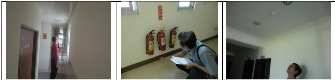
十九、11月22日(覆檢-合格) 大社區萬金巷8-9號5樓(江南龍園)租屋群 警、消防屋安全評核情形