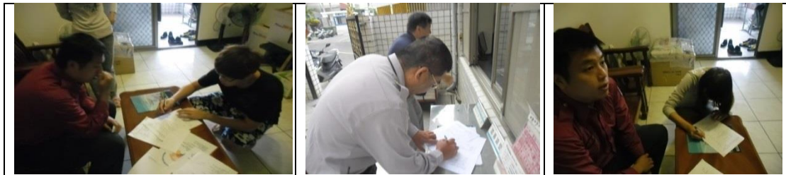
二十、11月16日(覆檢-合格)：大社區三民路376巷17號租屋群警、消 租屋安全評核情形