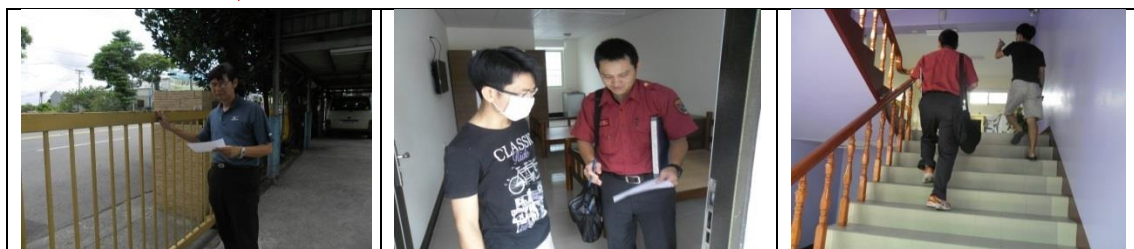
廿二、11月29日(合格)：大社區萬金路13-3號2樓租屋群警、消防屋安全評核情形