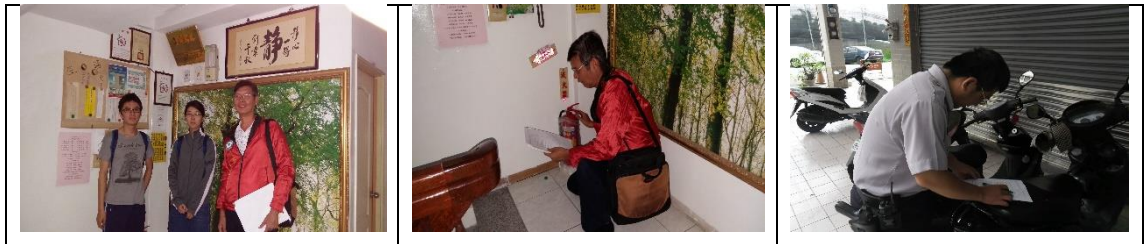
十五、11月28日(覆檢-合格)：大社區萬金路187號租屋群警、消防屋安全評核情形