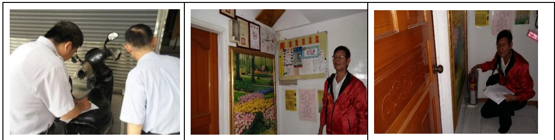
十六、11月28日(覆檢-合格)：高雄市大社區保社里15鄰萬金路357號租屋群安全評核情形