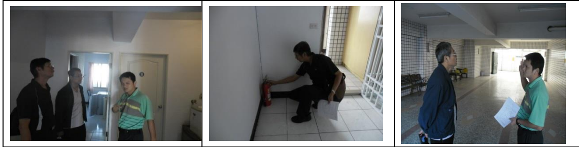
十八、11月28日(覆檢-合格) 翠屏學舍-大社區翠屏里翠屏路15號租屋安全 評核情形