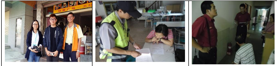
三、11月1日(覆檢-合格) 燕巢區東川路15-8號2樓之11租屋群警、消租屋安全評核情形-實施複檢