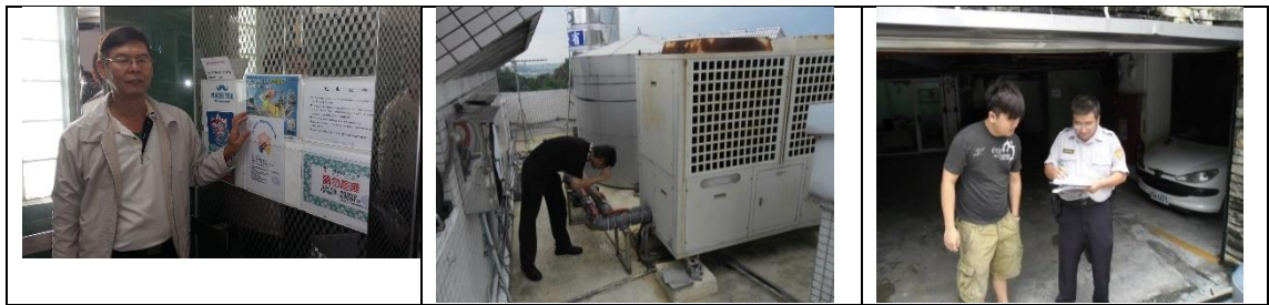
十四、11月28日(覆檢-合格) 大社區萬金路170號租屋群警、消防屋安全評核情形