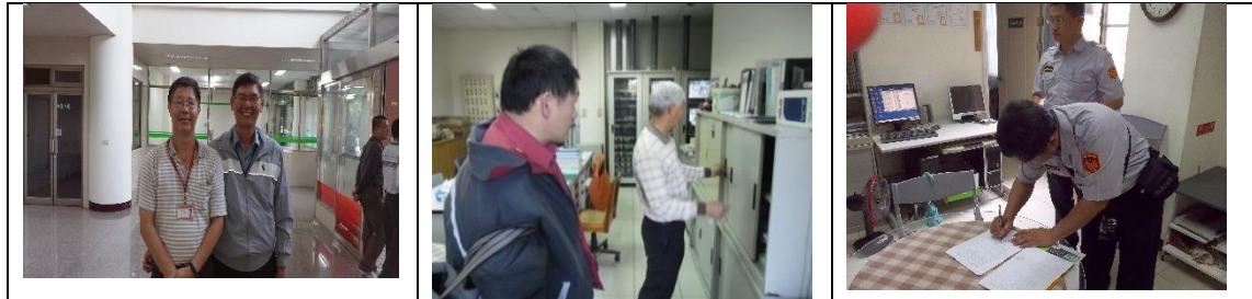
十、11月20日(覆檢-合格)：楠梓區中陽里朝明路114-1號租屋群警、消租屋安全評核情形