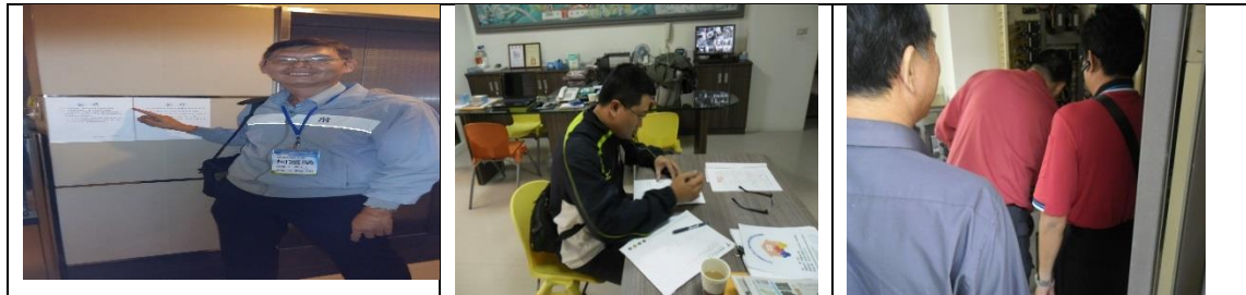
九、11月20日(覆檢-合格)：楠梓區卓越路51巷6號(台糖楠梓學苑)號租屋群警、消租屋安全評核情形