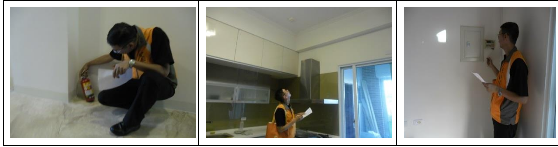
十七、11月28日(覆檢-合格) 大社區萬金路8之8號4樓-江南龍園租屋群 警、消防屋安全評核情形