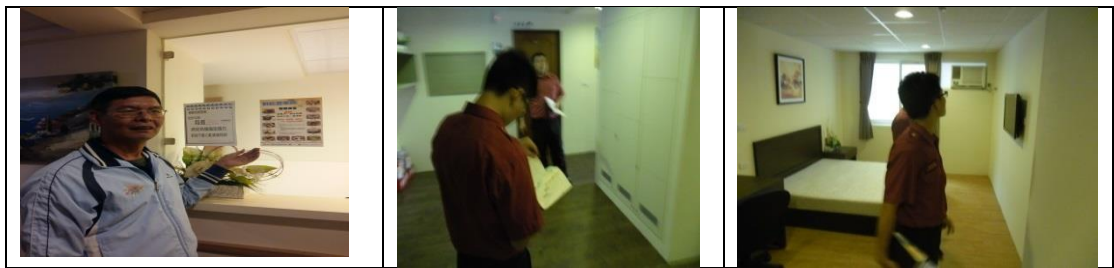
十七、12月12日(覆檢-合格) 大社區萬金路8之8號4樓-江南龍園租屋群 警、消防屋安全評核情形