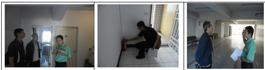
十八、12月12日(覆檢-合格) 翠屏學舍-大社區翠屏里翠屏路15號租屋安全 評核情形