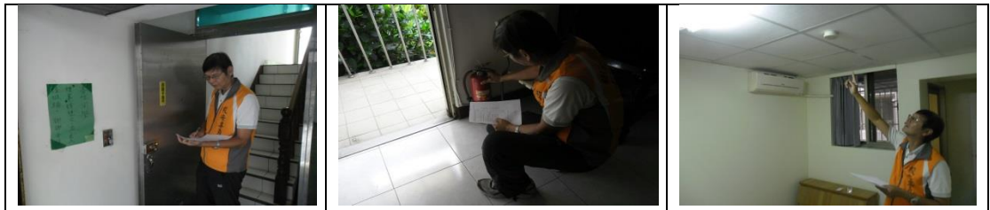
八、11月21日(覆檢合格)：高雄市楠梓區常德路386巷20號(里昂學舍)租屋群警、消防屋安全評核情形