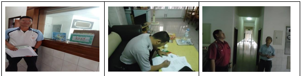
九、11月21日(覆檢-合格)：楠梓區中陽里朝明路114-1號租屋群警、消防屋安全評核情形