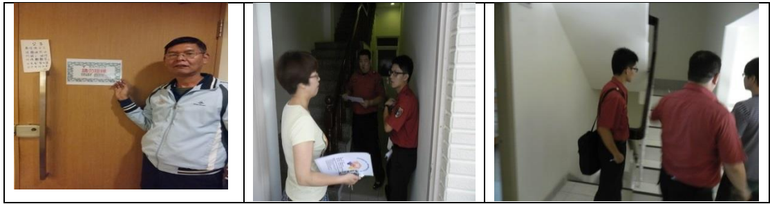
十五、12月12日(覆檢-合格)：高雄市燕巢區中民路526號之10租屋群 警、消防屋安全評核情形