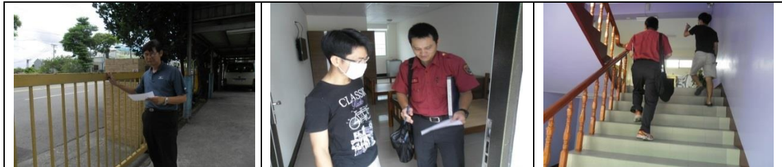
廿二、12月12日(覆檢合格)：大社區萬金路13-3號2樓租屋群警、消防租屋安全評核情形