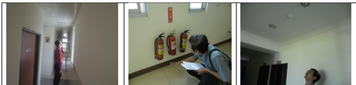
十九、12月12日(覆檢-合格) 大社區萬金巷8-9號5樓(江南龍園)租屋群