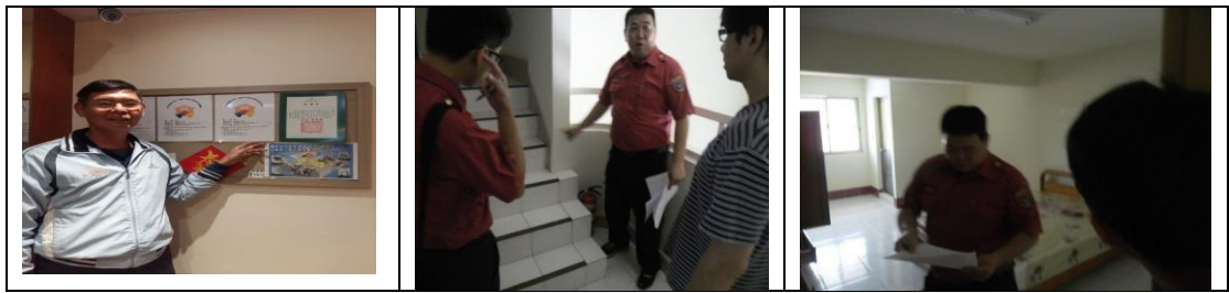
十六、12月12日(覆檢-合格)：高雄市燕巢區中民路526號之11租屋群 警、消防屋安全評核情形