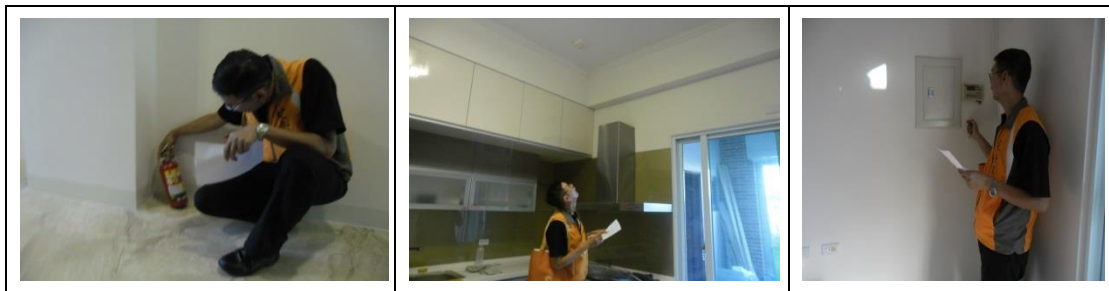
十四、12月12日(覆檢-合格)：高雄市燕巢區中民路526號之9租屋群