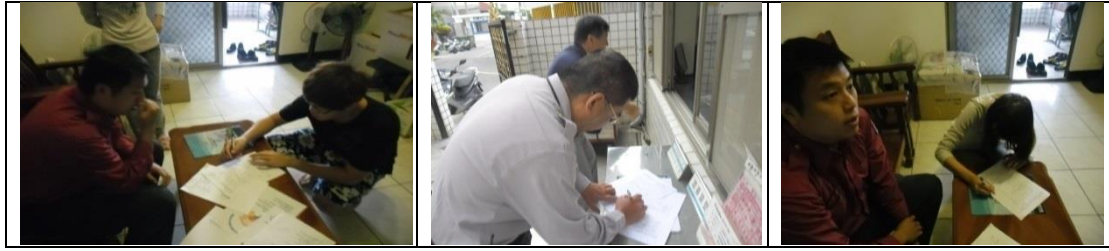
二十、12月12日(覆檢-合格)：大社區三民路376巷17號租屋群警、消防租屋安全評核情形