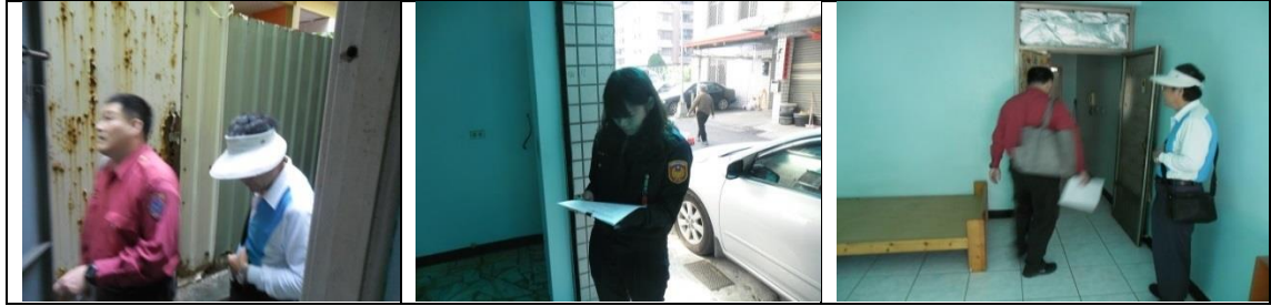
十一、11月21日(覆檢-合格)：楠梓新路261巷16弄12號4樓租屋群警、消租屋安全評核情形