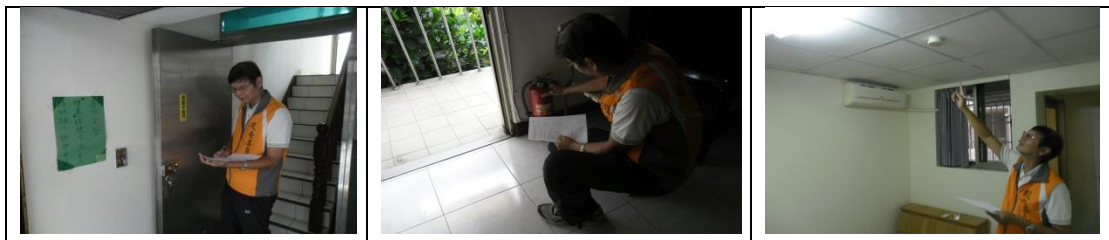
八、11月21日(覆檢合格)：高雄市楠梓區常德路386巷20號(里昂學舍)租屋群警、消租屋安全評核情形