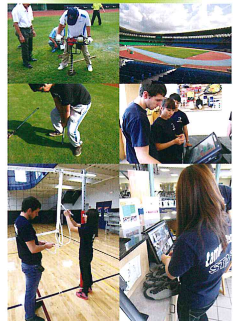
運動場館規劃與指導