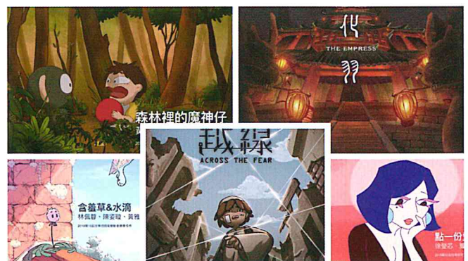
圖四：得獎作品海報