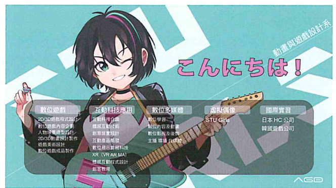
圖一：系所發展重心

(二) 工作室與專業教室：4間電腦教室、1間動態捕捉實驗室、1間手繪教室、1間創客實驗室、8間個人工作空間。1間電競館、3間電競選手培訓室、6間主導播培訓館、6間影音後製工程館、1間AR/VR體感互動館