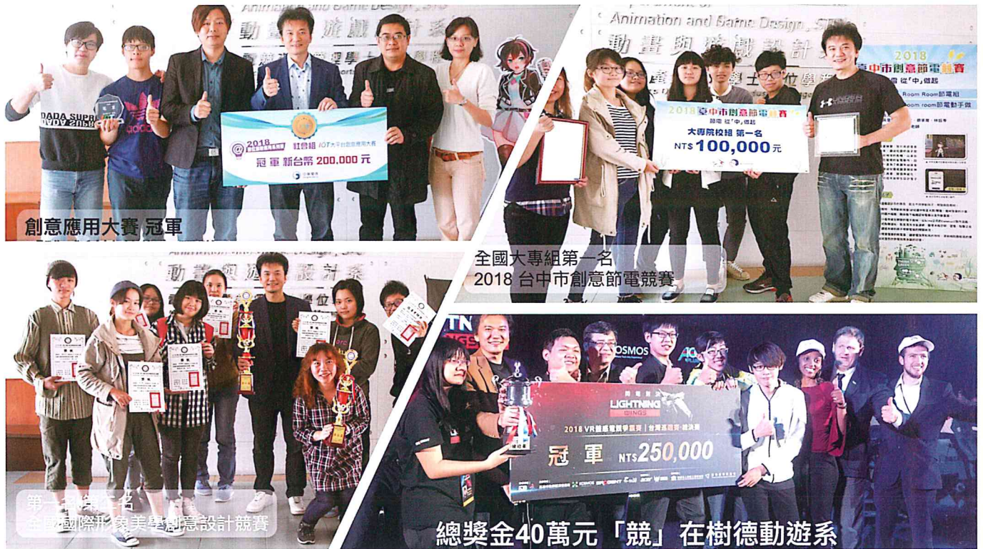
圖三：得獎榮譽事蹟