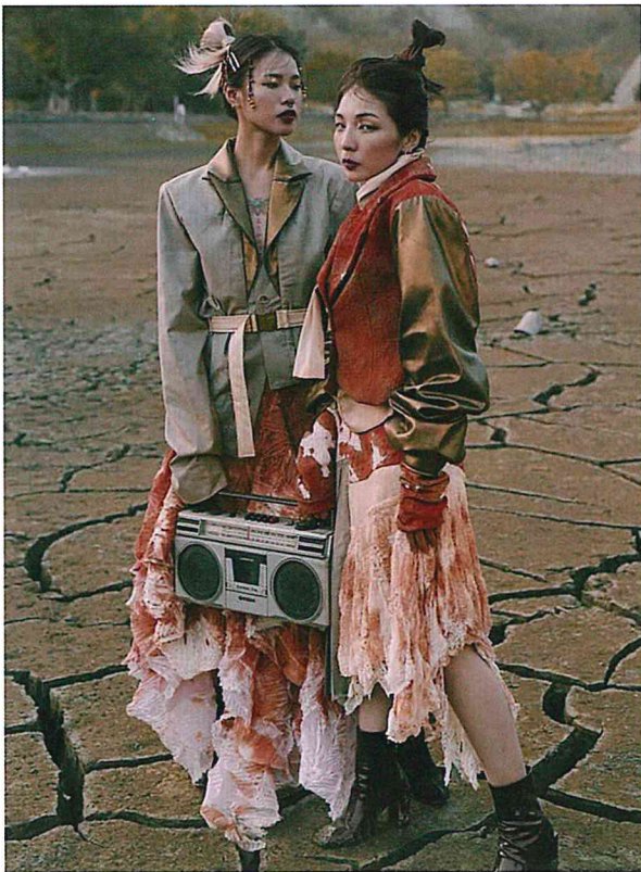
作品/ 惜惜八厝 設計師/ 謝玉婷、陳瑩妙、郭慈芸、許庭嘉