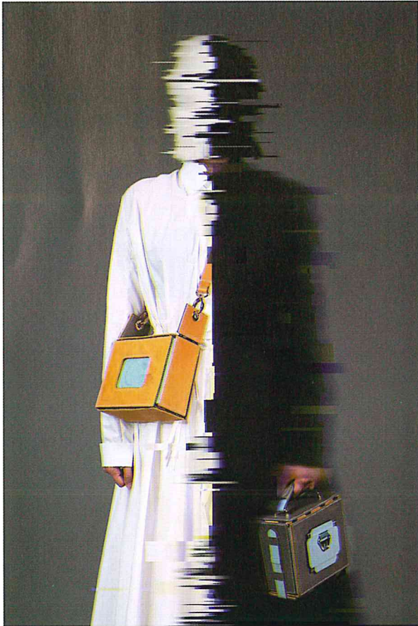
作品/ Gemini 雙生 設計師/ 余志杰