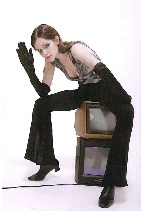
作品/ Noise 設計師/ 鄭嘉萱