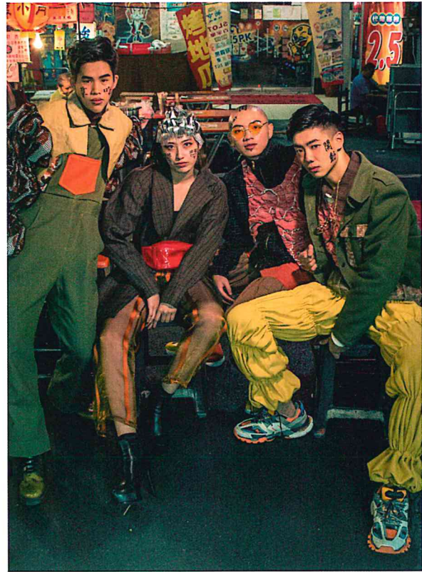
作品/ 慾望先生暴食中 設計師/ 王昕如、黃乙豪、林佳穎、吳秀靈