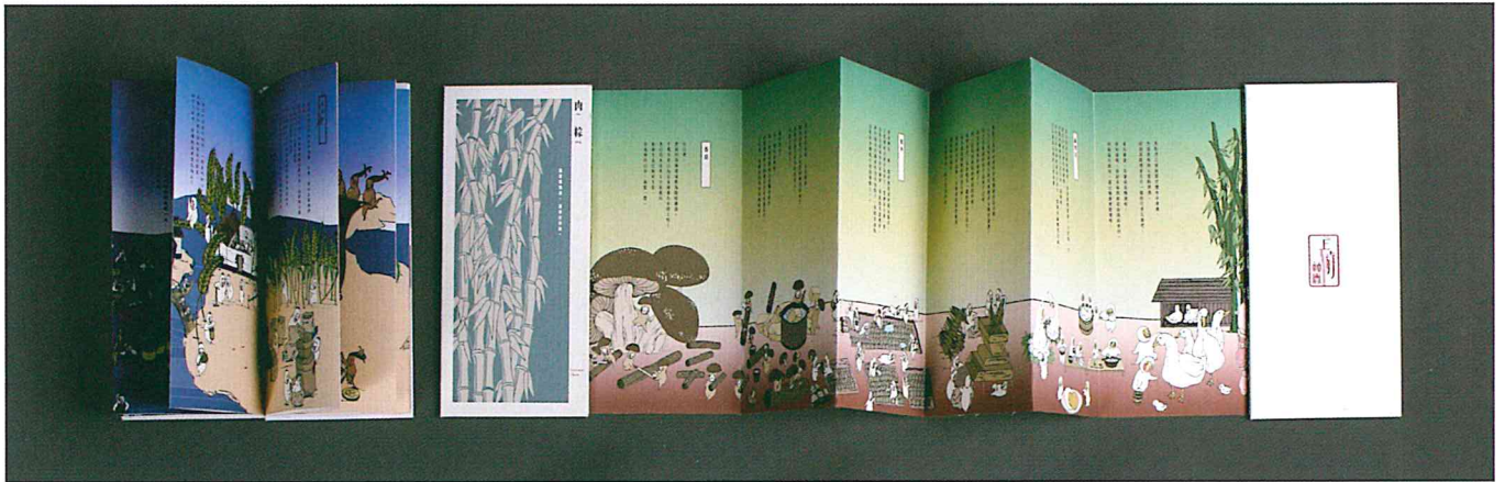
2017 德國紅點最佳設計獎《上游社會》

2013 德國iF概念獎 榮獲全球第三名 2016 德國iF概念獎 榮獲全球第一名 2015 德國紅點傳達類設計獎 共14件(含4件最佳獎) 2016 德國紅點傳達類設計獎 共9件(含1件最佳獎) 2017 德國紅點傳達類設計獎 共14件(含2件最佳獎) 2017 國際技能競賽 平面設計組世界金牌 2018 德國iF設計獎 專業類金獎 2018 德國紅點傳達類設計獎 共12件(含2件最佳獎) 2019 德國紅點傳達類設計獎 共9件(含1件最佳獎) 2020 德國紅點傳達類設計獎 共12件