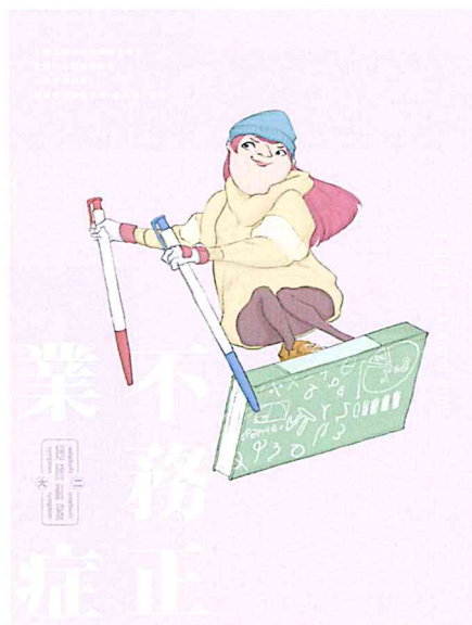
2020 德國紅點設計獎《學生症》02