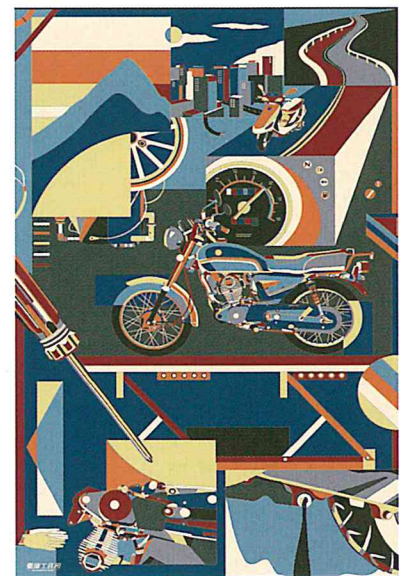
2018 德國紅點最佳設計獎《臺灣工務所》