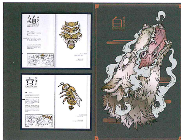
2017 德國紅點設計獎《俗畫說》