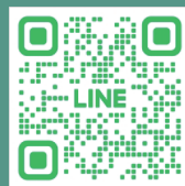
招生考試入學服務