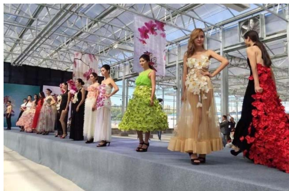
圖 3：2015 年 9 月 16 日第一屆五家渠國際蘭展盛裝開幕

資料來源： http://www.chinatimes.com/realtimenews/20141205004433-260405