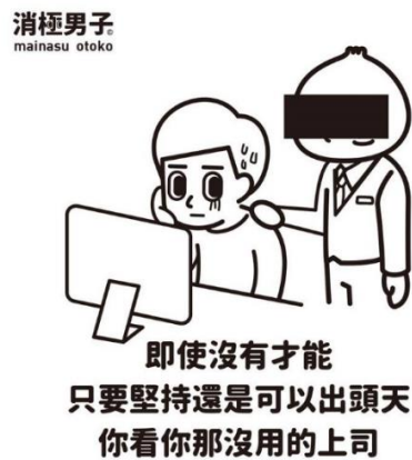
圖 1 插畫家「消極男子」以消極為主軸創作的插畫 (資料來源:MyPlus 加分誌, 2018)

二是較為正面影響; 在生活承受巨大壓力下, 喪文化便成為青年的宣洩口(姚寒夕, 2022), 進而平衡現今青年承受的壓力。